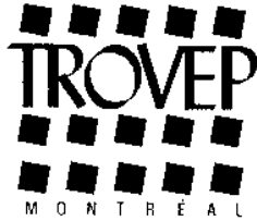
Table régionale des organismes volontaires d'éducation populaire de Montréal