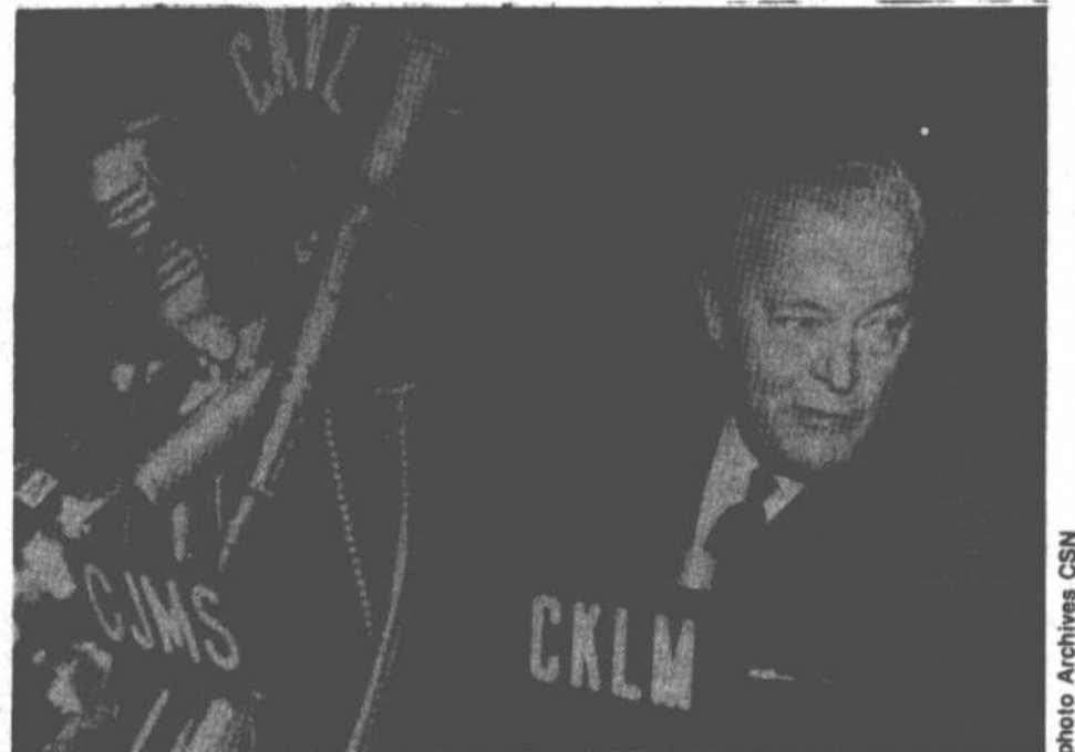
Jean Lesage a été Premier ministre du Québec de juin 1960 à juin 1966. Initialement, son gouvernement était favorable à l'Action sociale étudiante. Il changera rapidement son fusil d'épaule.

Ainsi à l'été 1965, avec l'aide de fonctionnaires du gouvernement du Québec, un premier projet, dans le cadre de l'action